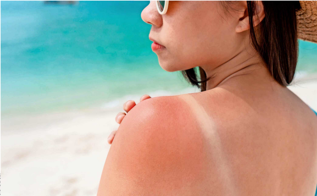
Se estima que cerca del 90% de los casos de cáncer de piel se relaciona con la exposición intensa y prolongada a la radiación ultravioleta, pero a este factor se suman otros riesgos.

De acuerdo con las proyecciones del Observatorio Global del Cáncer (Globocan), se estima que en 2025 se generaron más de 4.200 nuevos casos de cáncer de piel en el país, lo que representa un incremento cercano al 12% en comparación con las estimaciones de 2022. Asimismo, este organismo proyecta que, en el transcurso de la próxima década, el número anual de nuevos casos podría alcanzar los 5.800 pacientes, mientras que cerca de 913 personas fallecerían como consecuencia de esta enfermedad.