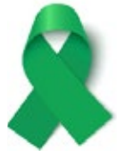
Cáncer de hígado