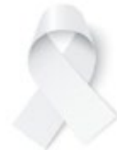
Cáncer de pulmón