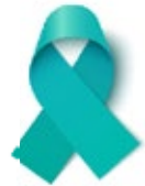
Cáncer de ovario