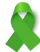
Cáncer de conducto biliar