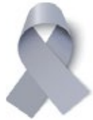
Cáncer de cerebro