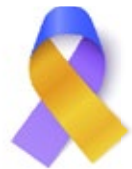
Cáncer de vejiga