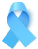
Cáncer de próstata