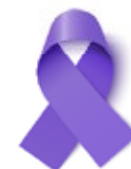
Linfoma de hodkin