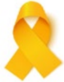
Cáncer de apéndice