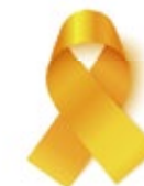
Cáncer de infancia