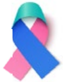
Cáncer de tiroides