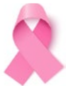
Cáncer de mama