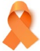
Cáncer de riñón