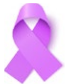
Todos los cánceres

Estos colores son transversales para países e instituciones. Sin embargo, su uso no es obligatorio para las comunicaciones referentes al cáncer del que hablan.