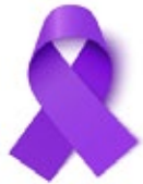
Cáncer de páncreas