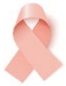
Cáncer de útero