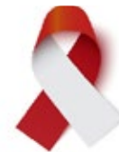
Cáncer de cuello y cabeza