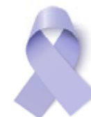
Cáncer de estómago