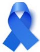
Cáncer de colon