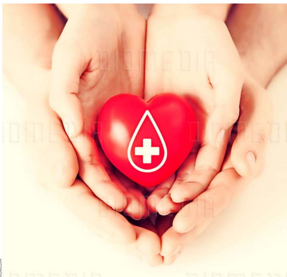
A nivel global, se estima que 1/3 de las donaciones de sangre se destina a pacientes oncológicos.

Si desea ser donante altruista de sangre en FALP, inscribise a través del sitio web, www.falp.cl .